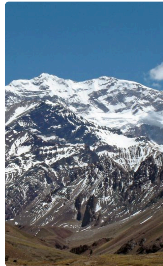
AVISTAMIENTO DEL ACONCAGUA