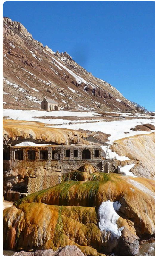
PUENTE DEL INCA